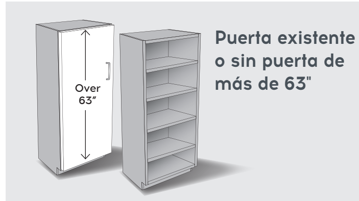
Puerta existente o sin puerta de más de 63"