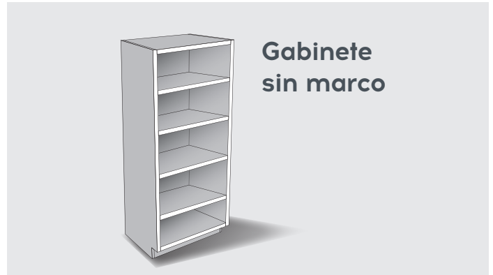
Gabinete sin marco

NOTA 1: La altura máxima de nuestro tamaño de puerta es de 63", para tamaños más grandes, deberá pedir 2 puertas. NOTA 2: Sus puertas se unirán entre sí utilizando nuestro kit de reparación.